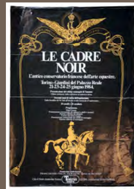
FIG. 4. - Programmes et affiches des galas, Saumur, Carrousel, Arc et Senans (1980), Turin (1984)