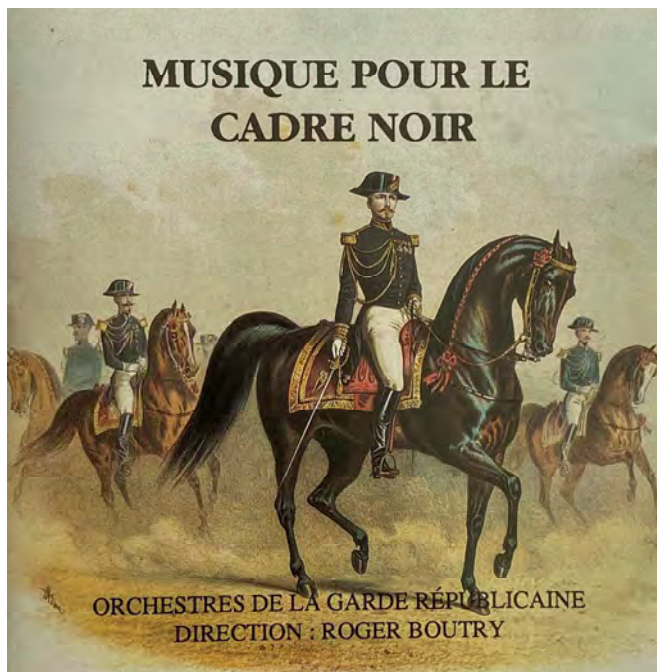
FIG. 5. - La pochette du CD de la bande originale des reprises du Cadre noir

L'accompagnement musical devait évoluer. À mes débuts, un disque, puis une bande d'un enregistrement médiocre, servait à l'accompagnement des reprises ; tout cela datait, il était urgent de le refaire. La Musique