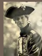
FIG. 2. - Un élève de l'ENE en tenue de carabinier du comte de Provence

-Pour la première partie, j'eus l'idée d'impliquer les élèves du Cours de formation d'instructeurs, revêtus du costume de carabinier prêtés par l'École de cavalerie pour l'occasion,