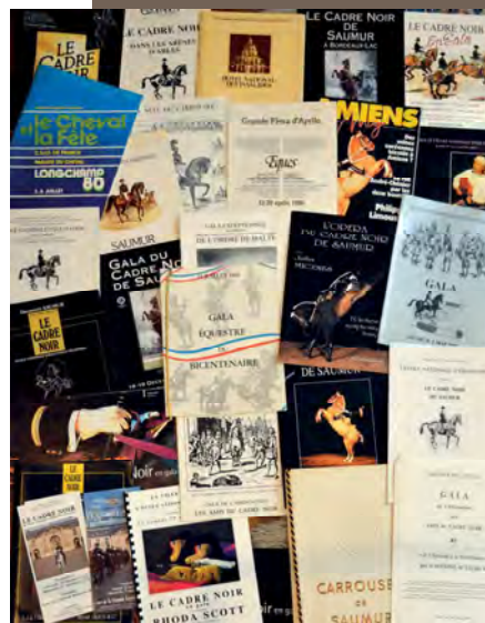
FIG. 3. - La diversité des programmes de gala